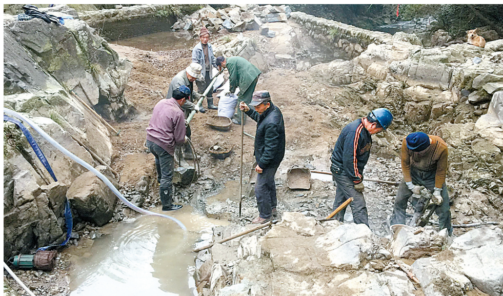
朱敏村饮用水安全提升工程现场。

其中，山区村庄是农村饮用水安全的聚焦点。该负责人介绍，海曙部分村级站中存在着净化消毒设施不全、供水管道更新等问题，此外“看天吃水”现象严重。且溪坑、小山塘基本无人管护，水质安全问题不容乐观。为此，海曙按照“农民饮用水达标提标专项行动”的要求，以水质和水量达标为出发点，以建设和管理提标为着力点，2018年至2020