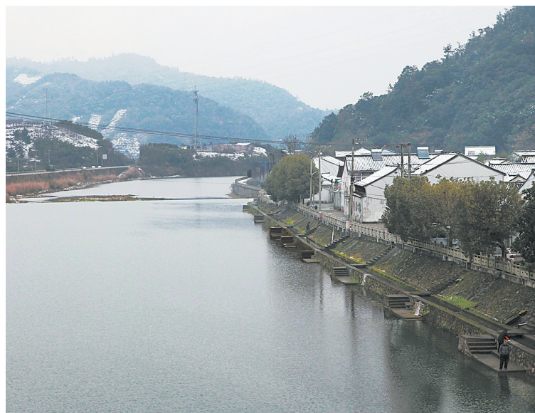
青山、秀水、村舍融为一体。