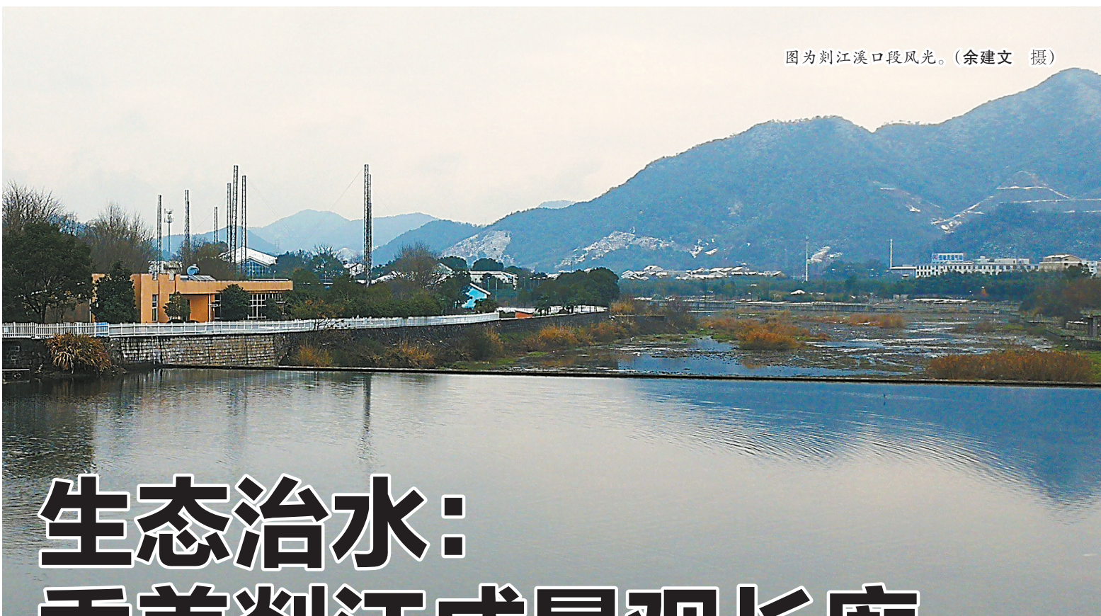
图为剡江溪口段风光。