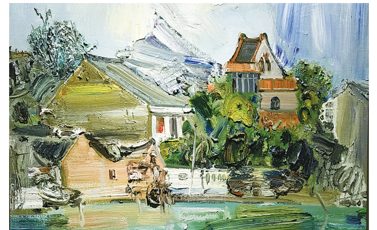
任昌久的油画作品

现在，任昌久将艺术创作的重心放在宁波。朋友在鄞州区因村教育城为他提供了两间办公室作为画室，他每天都在画室里不停地画画。他说余生要为精神而活，为绘画而活。