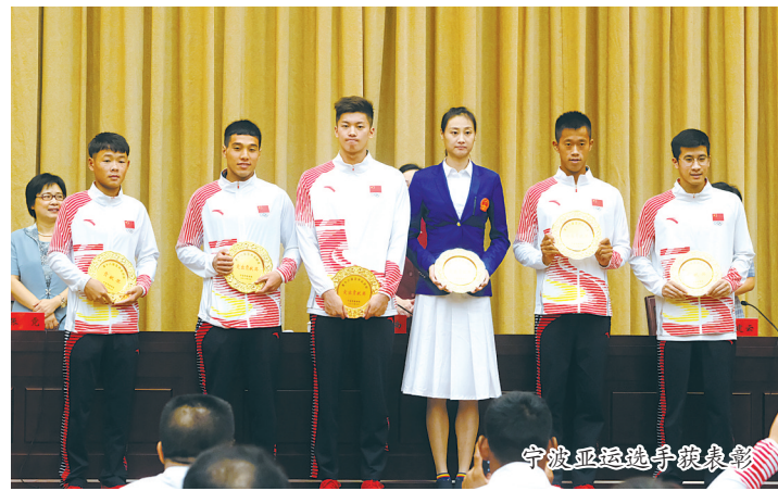
宁波亚运选手领奖彩

2018年6月20日，宁波市体育局与宁波大学举行战略合作签约仪式，宁波科学运动与健康研究院正式在宁波大学挂牌，双方以大健康研究院、附属医院和体科所为依托，以健康宁波与体育现代化建设为导向，搭建跨学