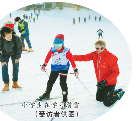
小学生在学习滑雪

展规划（2016—2025年）》提出，“直接参加冰雪运动的人数超过5000万，并带动3亿人参与冰雪运动……”要实现这个目标，相当于每5个中国人约有1人参与冰雪运动。这当然少不了包括浙江在内的南方省份。