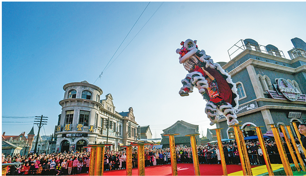
春节期间，象山影视城的舞狮表演吸引了众多游客。

在创建5A级景区的过程中，天一阁完成了16大项目的改造提升。2018年，新开发文创产品18种，门票收入超过1300万元，文创产品销售额实现了14%的增长。