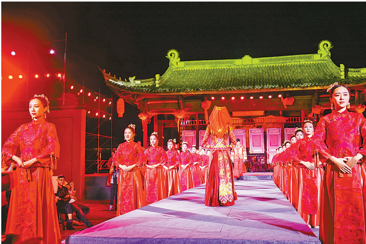
情景剧《梦回四十七房》让游客身临其境了解当地独特的民俗文化。

缺乏高端复合型创意型人才、市场营销人才及高级管理人才，导致文旅融合发展的内生动力不足。