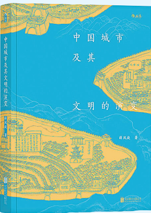
《中国城市及其文明的演变》 薛凤旋 著 北京联合出版公司 2019年1月