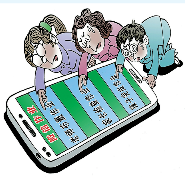
“微”逼 蒋跃新 绘