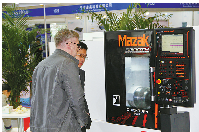
专业的展会吸引了不少国外客商。

虽然下着小雨，但宁波国际会展中心仍然人潮涌动。第二十届中国国际机床装备展览会以及第五届宁波国际机器人、智能加工与工业自动化展览会的举办，吸引了众多寻求与智造结合的小微企业。