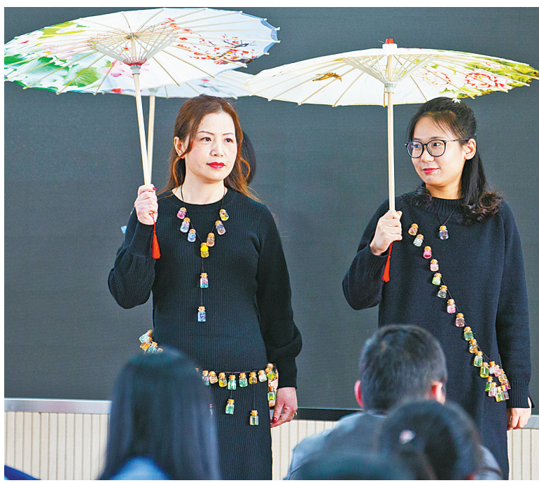
近日,海曙南门街道举办了一场“微治理·小景观”创意展示大赛,来自辖区11个社区的社工自编自导自演,通过情景剧、小品和诗朗诵等形式,生动形象地演绎了辖区101名社工日常工作的点点滴滴。图为柳锦社区的社工把花瓶罐罐穿在身上走秀,展示他们这个废旧玻璃回收试点社区特有的风采。

2018年,宁波投入近千万元开展专业服务项目300余个,社会工作者实施个案、小组、社区服务3000多次,服务群众2万余人次。