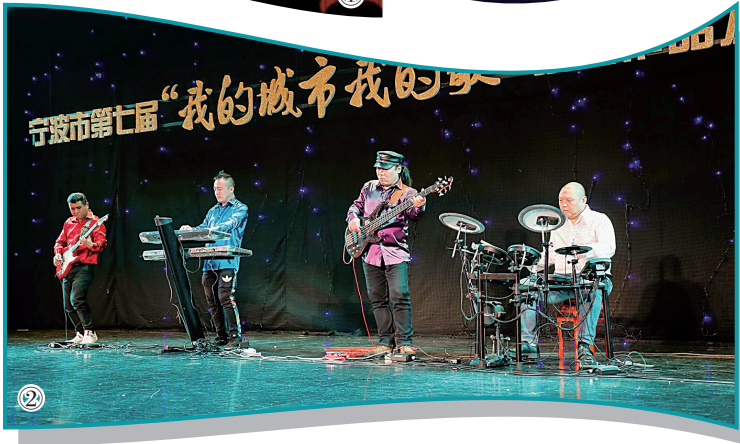
①②第七届“我的城市我的歌”获奖作品发布音乐会。