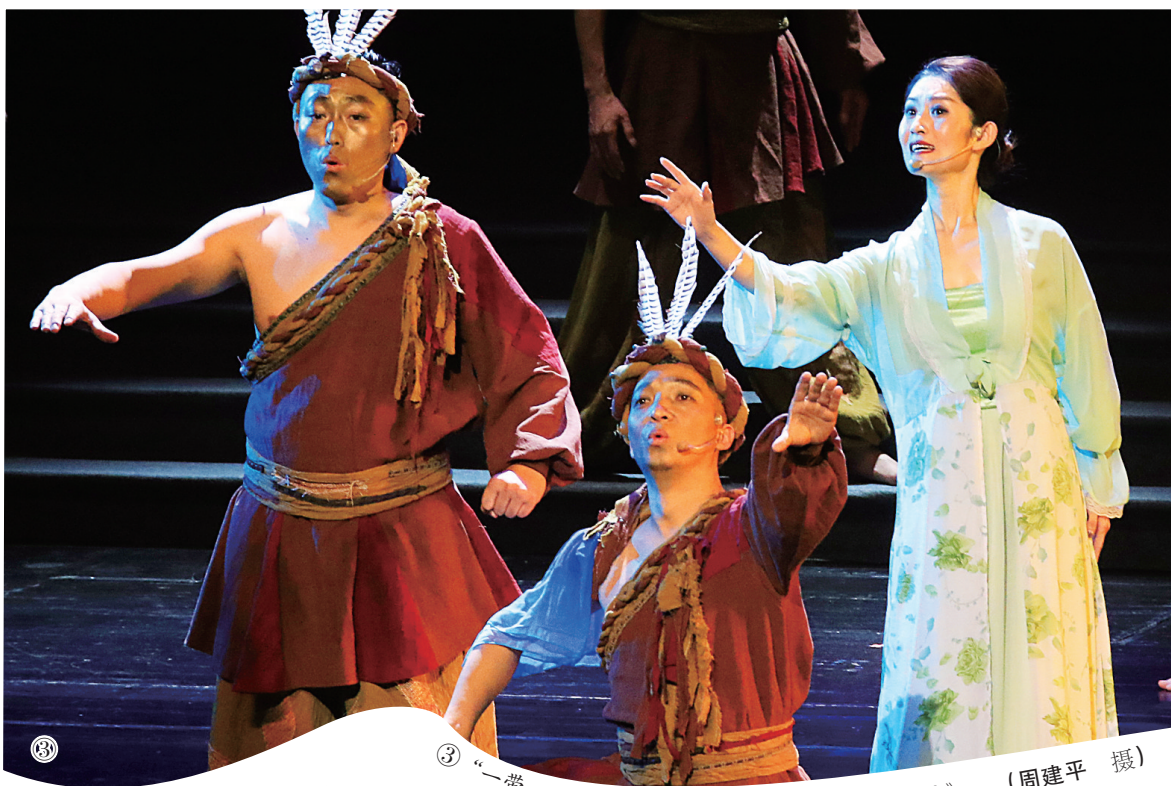
③“一带一路”主题原创音乐会上演唱《羽人竞渡》。