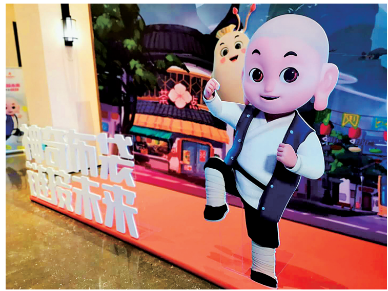
“神奇布袋小子”卡通形象发布。

发布会上,溪口镇向全球范围发出“布袋弥勒”IP运营计划合作邀请,并与首批5家协作企业签约。溪口名山建设管委会相关负责人表示,借助《神奇布袋小子》的全面上映,溪口将超级IP与区域发展相结合,在动漫文创、主题娱乐、玩具游戏等领域招商授权,汇集一批优质企业,共同打造中国首个祈福IP动漫全产业链。