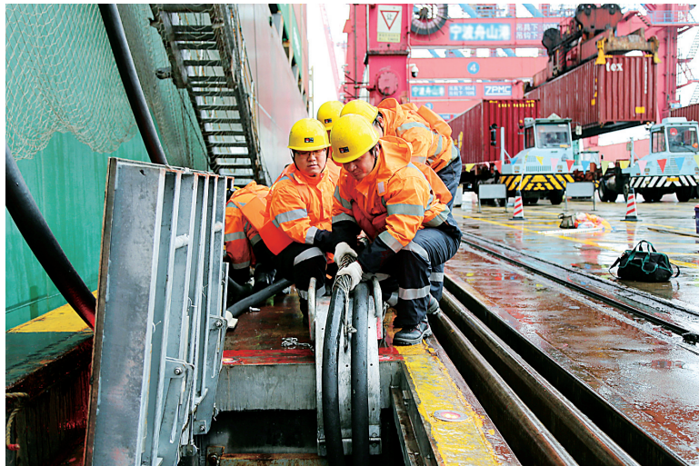
码头工人正在为船舶接电。

26个,已建岸电设施泊位16个,覆盖率62%;宁波舟山港宁波港域5万吨级以上干散货泊位12个,已建岸电设施泊位6个,覆盖率50%。