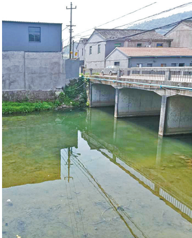
被污染的河道已经清理干净。