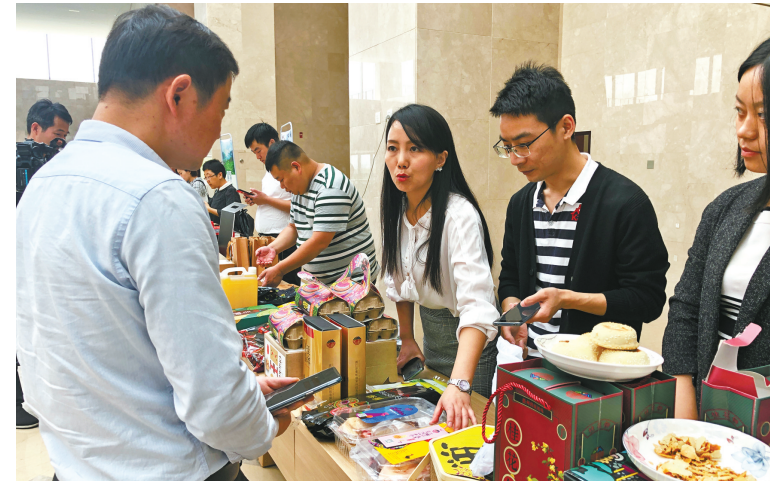
全市“消费扶贫 机关先行”活动启动仪式。

上,切片的新疆吐鲁番引来不少人品尝。从一个苹果起家,到如今的黑枸杞、羊奶片、核桃、杏仁、纯牛奶、代餐酸奶、黄冰糖等100