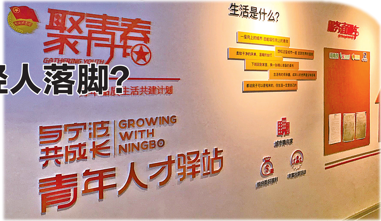
图为北仑青年人才驿站。