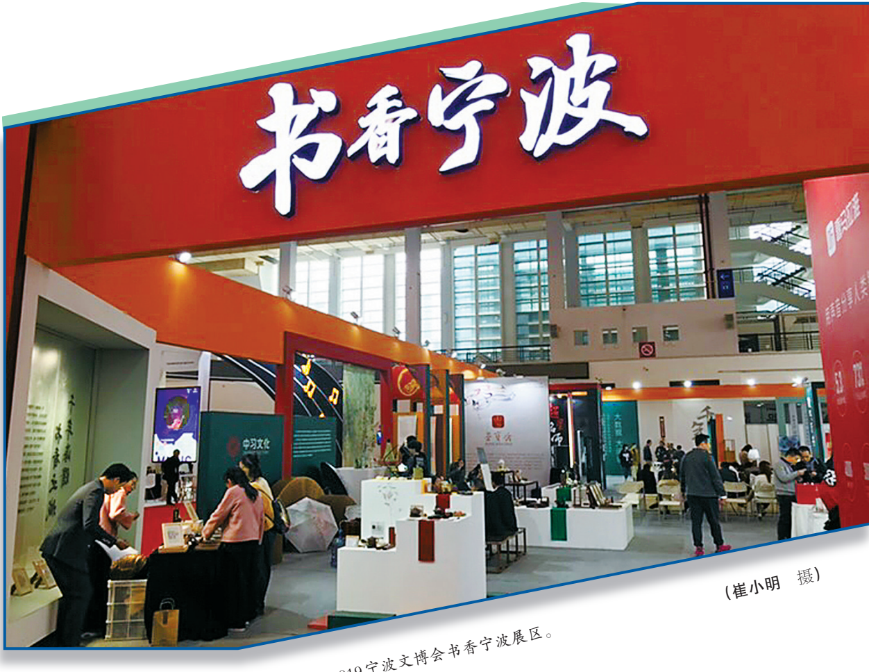
2019宁波文博会书香宁波展区。

4月23日是世界读书日。连日来，全市各地掀起了一波又一波推动阅读、倡导阅读的热潮。伴随着互联网技术的发展，以电子阅读、有声阅读为代表的数字阅读风生水起，改变了很多人传统的阅读习惯，受到越来越广泛的喜欢。