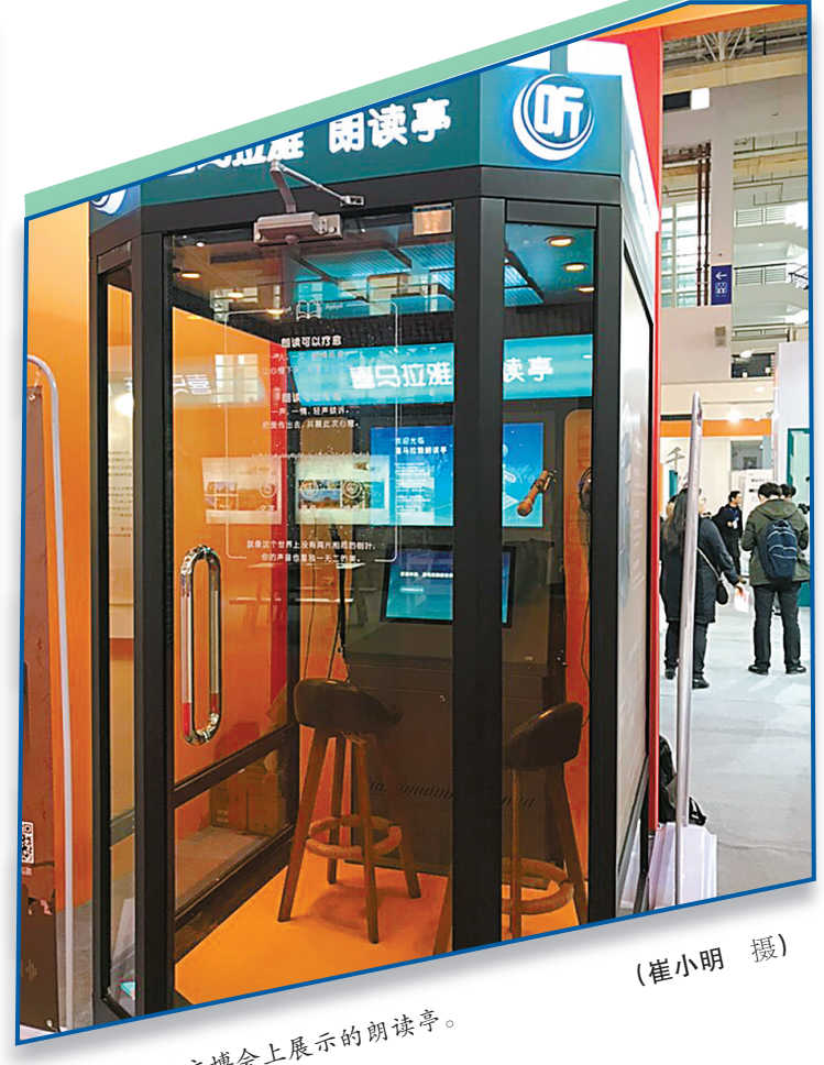
2019宁波文博会上展示的朗读书亭。