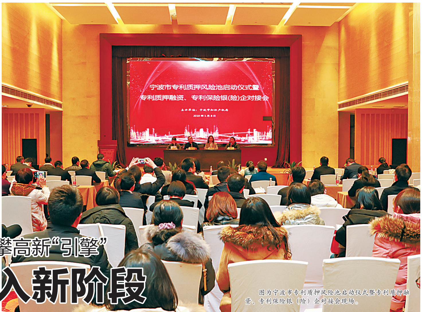
图为宁波市专利质押风险池启动仪式暨专利质押融资、专利保险银(险)企对接会现场。