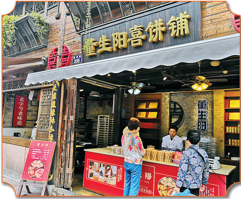
南塘老街的董生阳门店。

号企业找到了依靠。除了已获得中华老字号和浙江老字号荣誉的企业,还有一些基本符合年限要求的“准老字号”加入进来。其中,宁波水表在入会5个月后就拿到了浙江老字号的牌子,1978年开始有活动踪迹的陆龙兄弟也接受邀请加入协会,弥补了水产领域老字号的空白。