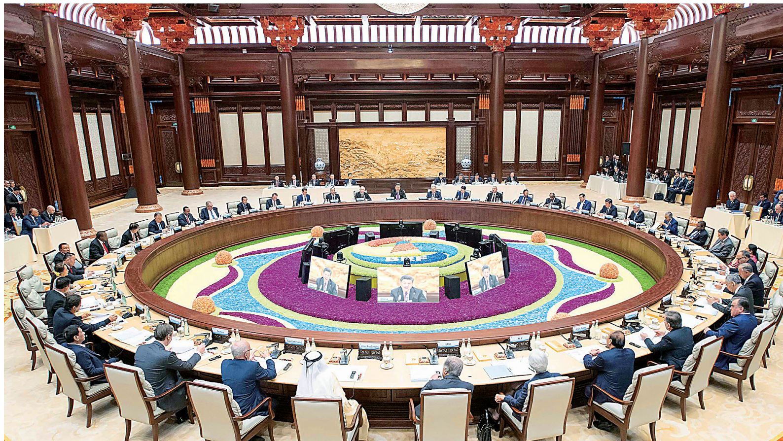
4月27日,第二届“一带一路”国际合作高峰论坛在北京雁栖湖国际会议中心举行圆桌峰会。