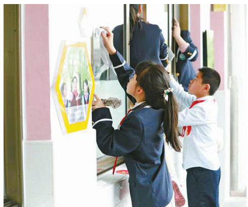
孩子们比赛打扫卫生。

昨天是校级层面的劳动技能大比拼活动,由各班挑选出来参赛的劳动小能手代表,一个个摩拳擦掌,跃跃欲试。比赛考查的不仅仅是正确科学的劳动技能和方法,还要考验孩子们的劳动细节意识和观察审美能力。