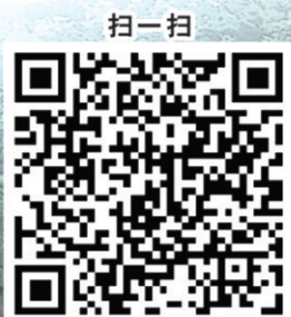
进入黑恶违法犯罪举报平台