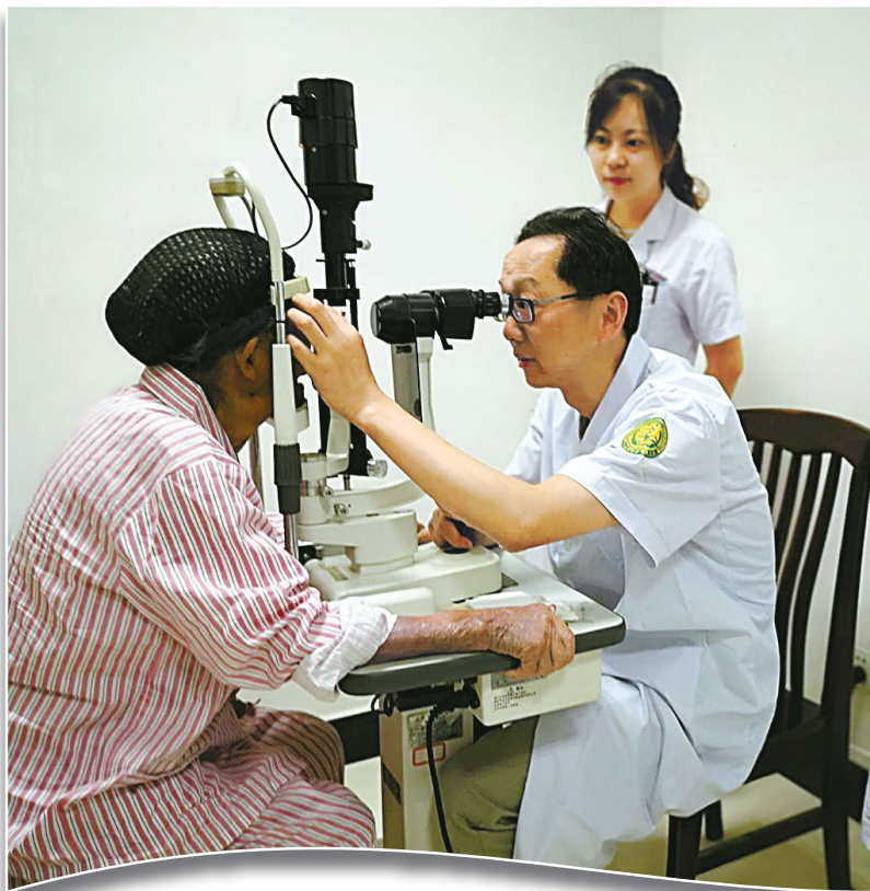
宁波医生在黔西南州贞丰县进行公益医疗帮扶。