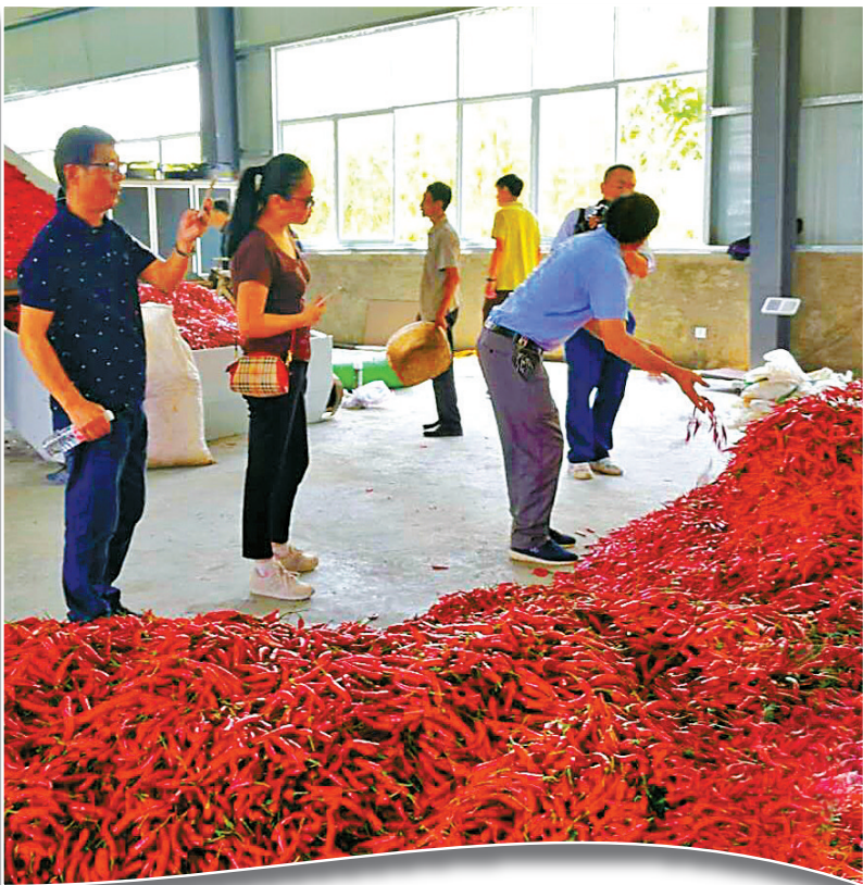
宁波帮扶资金建设的普安县白沙乡辣椒烘干厂。