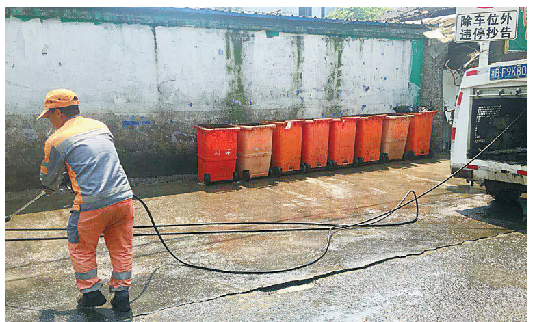
鄞州区环卫部门正在对钟盈二期商务楼对面的垃圾堆放点进行清理。