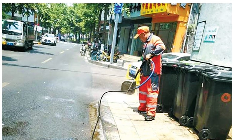
海曙区环卫部门正在对鼓楼街三江超市门口的垃圾清运点进行清理。