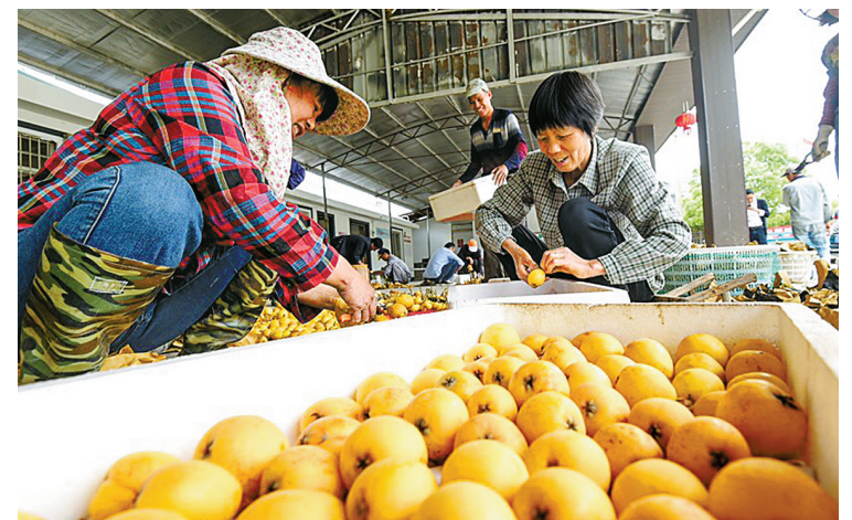
近日,在象山县泗洲头镇上马岙村,果农正把白枇杷打包装箱。目前,我市各枇杷基地的枇杷已陆续成熟,市民可品尝到新鲜味美的地产枇杷,价格在每公斤30元左右。

“应届高中毕业生高职扩招”考生参加6月全省统一的单独考试招生文化课考试,在报名信息现场确认点所在地参加考试。“退役士兵高职扩招”“下岗失业人员、农民工、新型职业农民等高职扩招”考生参加由招生院校组织的职业适应性测试或技能测试。具体考试要求由各招生院校自主确定,并向社会公布。考生根据各院校招生章程参加考试,并由招生院校按招生章程相关规则择优录取。