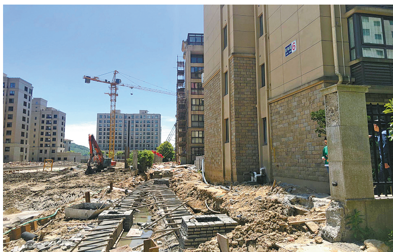
工地紧挨着巨和苑小区住宅楼,中间没有任何围挡。

根据网友投诉,记者上周末前往象山实地探访。在现场展示着的施工平面图、施工效果图上,记者看到,该项目名为“象山港路与海山路交叉口西南角地块一工程”,建设用地面积6333平方米,将新建5幢住宅楼,其建设单位为浙江中北置业有限公司,施工单位为宁波大成建设有限公司。