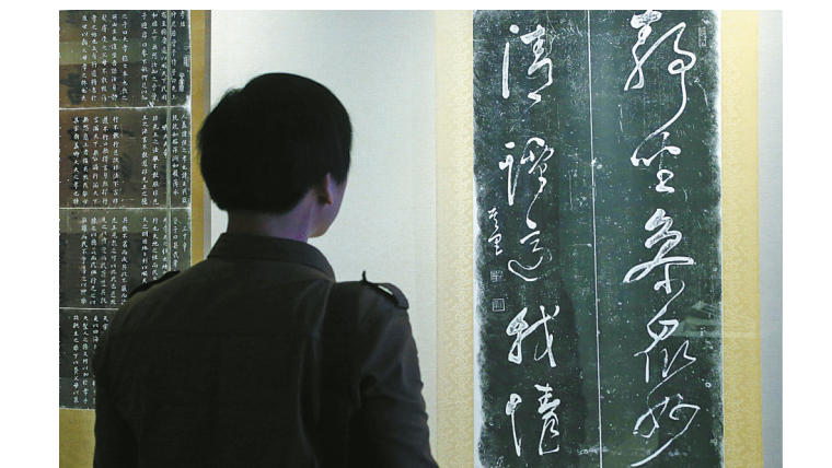
欣赏董其昌碑刻拓片

《董其昌临兰亭序》原碑有两方，上墙林宅西花园。董其昌在帖后有跋：“每以修禊日，临写兰亭，今春仲，游武林，候梅花，经旬风雨，遂缓归棹，三月三乃在雨篷，了无书兴，以正午补之。其昌。”还有“宗伯学士”“董氏玄宰”两枚篆文方印。董其昌临摹的《兰亭序》送给了好友陈继儒。