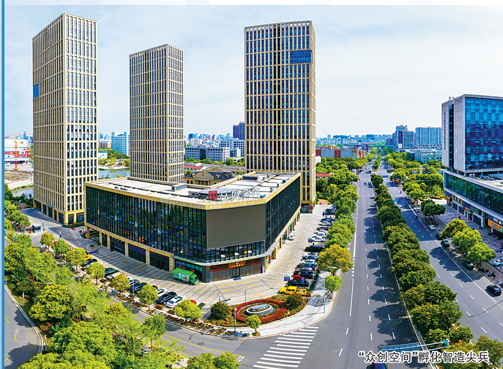
“众创空间”孵化智造尖兵

围绕“365”产业体系，聚焦新材料、生物医药、高端装备等特色优势领域，加快建设一批重点项目，培育孵化一批具有较强创新能力的行业龙头企业，力争今年规上战略性新兴产业增加值增速超过15%、高端装备制造增加值增速超过8%。