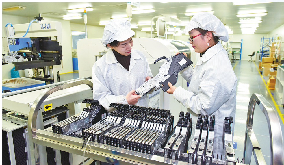
海曙智造发力“高精尖”。

凤凰涅槃、腾笼换鸟，有了空间，优质产业才能茁壮成长。在不断优化营商环境的同时，海曙借力“亩均论英雄”改革、小微企业园建设，不断加大“低散乱”整治力度。截至目前，海曙已建立336家低效企业“一企一档”信息库，整治提升“四无”企业（作坊）175家。