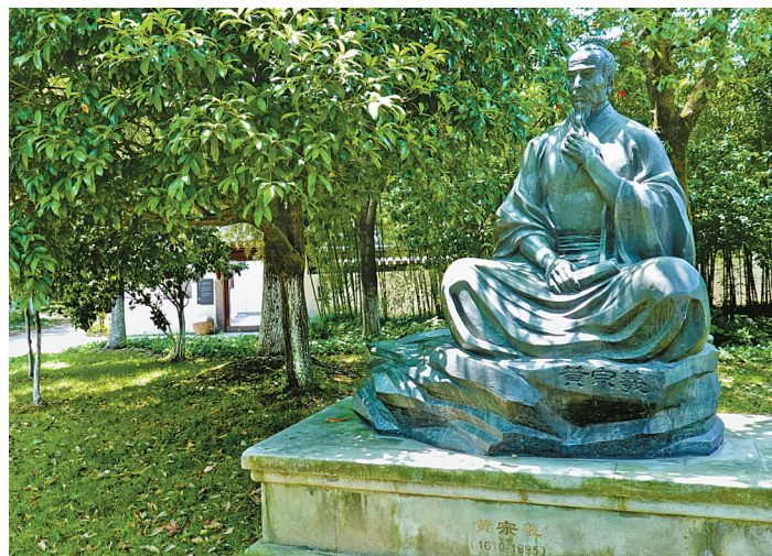
白云庄前的黄宗羲像。

今年5·18国际博物馆日当天，提升改造后的白云庄以崭新的面貌重新向公众开放，增加了智慧导视系统等新技术，继续宣扬浙东学派历史，传递浙东学派精神。