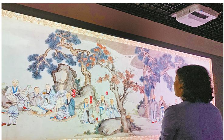
数字化展示《鄞江送别图》。