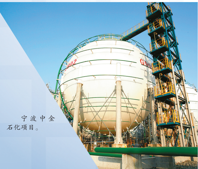
宁波中金石化项目。