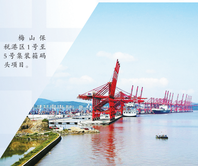
梅山保税港区1号至5号集装箱码头项目。

9年来，中国进出口银行宁波分行始终坚持合规文化建设引领，深入推进合规管理长效机制建设，构建主动合规制度体系，树立“合规从高层做起”的理念，通过开展“一把手讲合规”等系列合规文化建设活动，通过正面引导与反面警示相结合、业务培训和思想引导相结合、问题整改交流与督办相结合的方式，建立“合规人人有责”的理念，引导每一位员工成为合规文化建设的建言者、参与者和执行者，确保员工行为“时时合规”、业务发展“环环合规”，形成“内控有制度、部门有制约、岗位有职责、操作有程序、过程有监督、风险有监测、工作有评价、责任有追究”的良好工作局面。