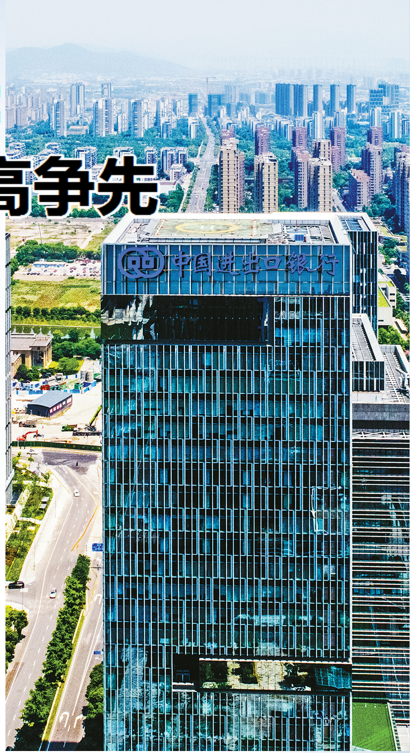
中国进出口银行宁波分行与城市同发展。

该行还突出重点国别、聚焦重点产业，积极利用境外承包工程贷款、境外投资贷款等各种贷款品种，大力支持宁波优质企业“走出去”，到境外投资建厂或并购国外优质资源和先进技术。目前，中国进出口银行宁波分行已成功支持了7家宁波企业8个项目的“走出去”贷款，主要涉及美国、英国、越南、加拿大、加蓬等地。