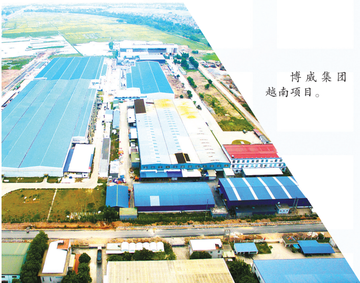
博威集团越南项目。