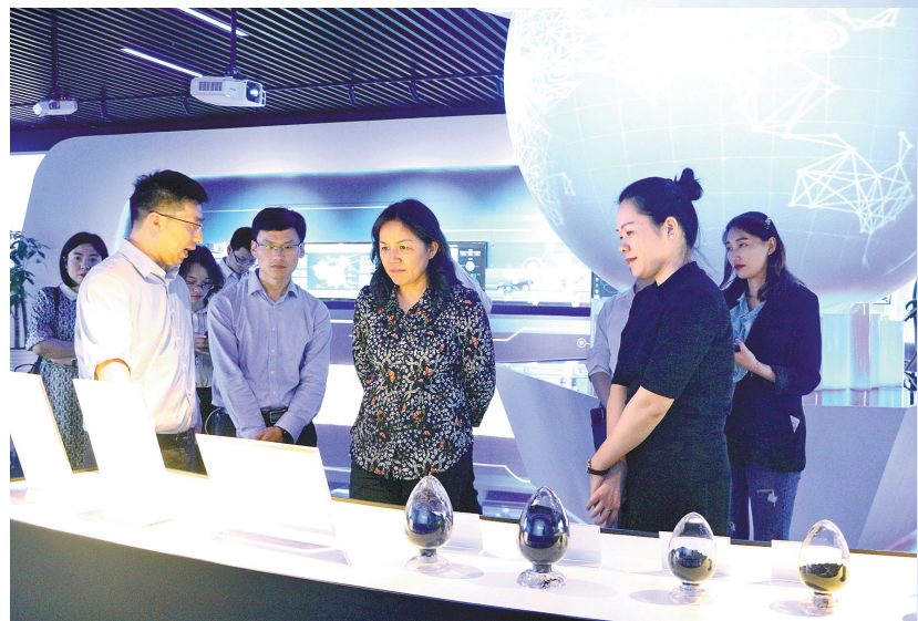
分行领导带队，深入企业调研金融服务需求。

提高民营企业的获得感。截至2019年4月末，中国进出口银行宁波分行民营企业贷款余额151.68亿元，占全行表内贷款余额的40.40%，民营企业客户数占全部客户数的44.54%。支持了雅戈尔集团股份有限公司、宁波杉杉股份有限公司、奥克斯集团有限公司等一批优秀民营企业参与国际竞争，加快产业布局，牢牢站稳国内国外两个市场。