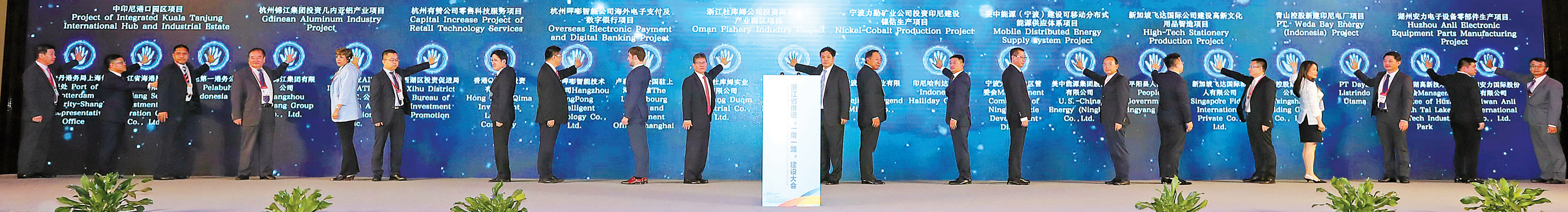
昨日，浙江省推进“一带一路”建设大会上举行重大合作项目签约仪式。

SIGNING CEREMONY OF THE MAJOR PROJECTS ON BELT AND ROAD INITIATIVE