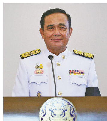
6月11日，在泰国曼谷，泰国总理巴育发表讲话。