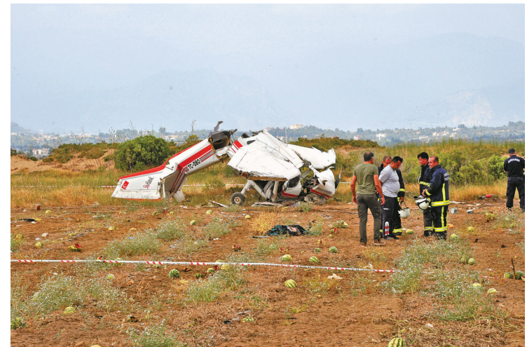
6月10日，在土耳其安塔利亚省马纳夫加特区，救援人员在坠机现场工作。

当日，土耳其一架教练机在南部安塔利亚省马纳夫加特区失事，造成机上人员2人遇难，1人重伤。