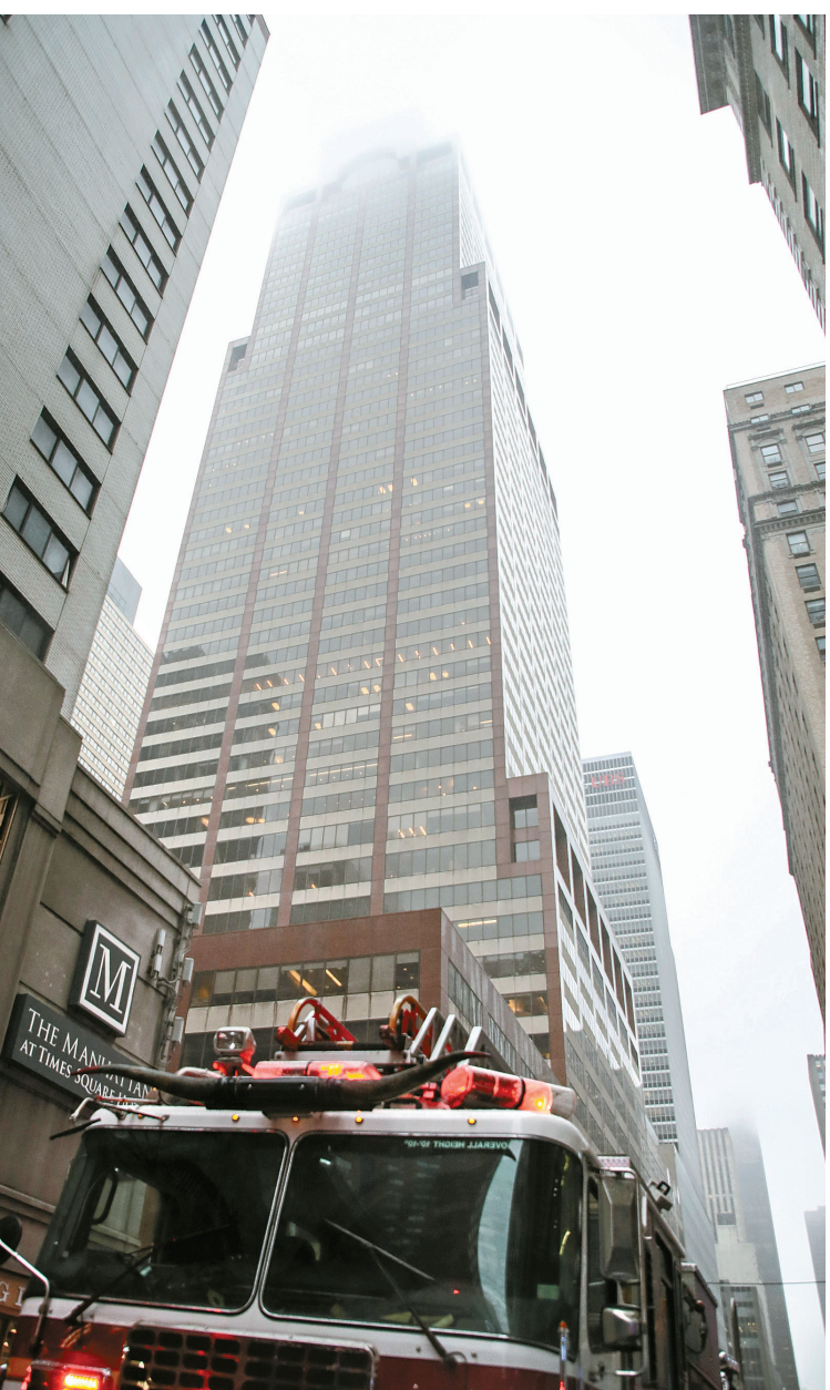
6月10日，在纽约曼哈顿拍摄的直升机在楼顶坠毁的写字楼。