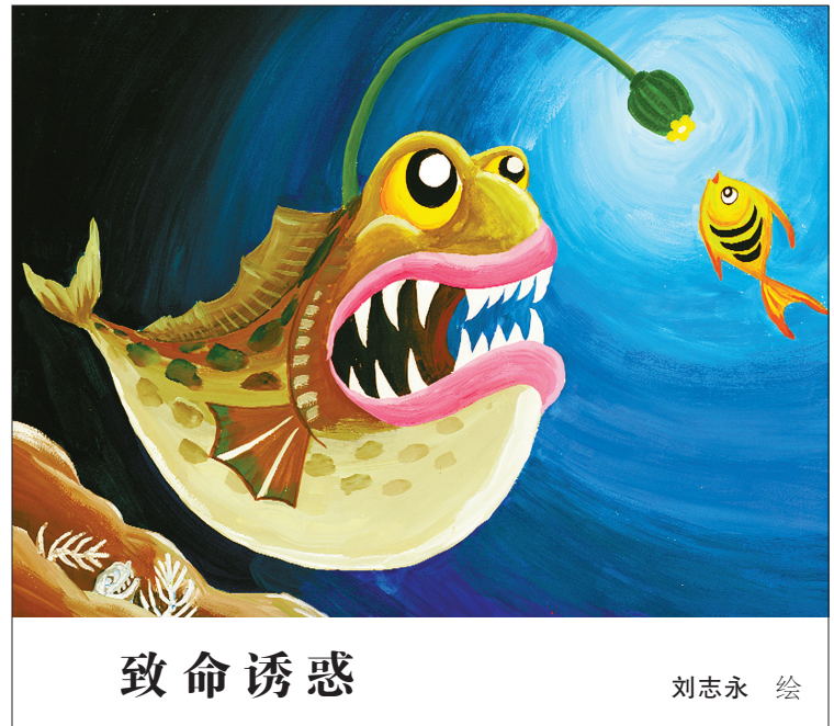
致命诱惑 刘志永 绘

创办“公牛学院”是三方聚焦于人才培养所开展的合作，旨在实现教育链、产业链与咨询服务链的有机链接，旨在实现应用型人才培养机制与创新创业机制、价值创造机制的良性耦合。在人才培养业态上，作为人才供给侧的院校主动与需求侧的企业