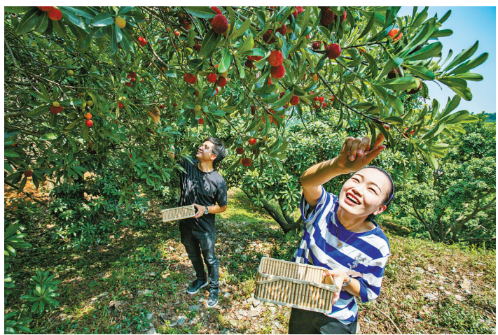
昨日上午, 在慈溪市匡堰镇一采摘园, 游客忙着采摘杨梅。

余姚是“中国杨梅之乡”, 每年举办中国余姚杨梅节, 今年已经是第33届了。杨梅节的主题, 已从早期的“以梅引商”“杨梅搭台, 经济