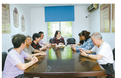
各方通过“居民说事”解决问题。