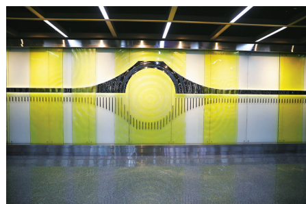
大通桥站文化墙《水韵》。