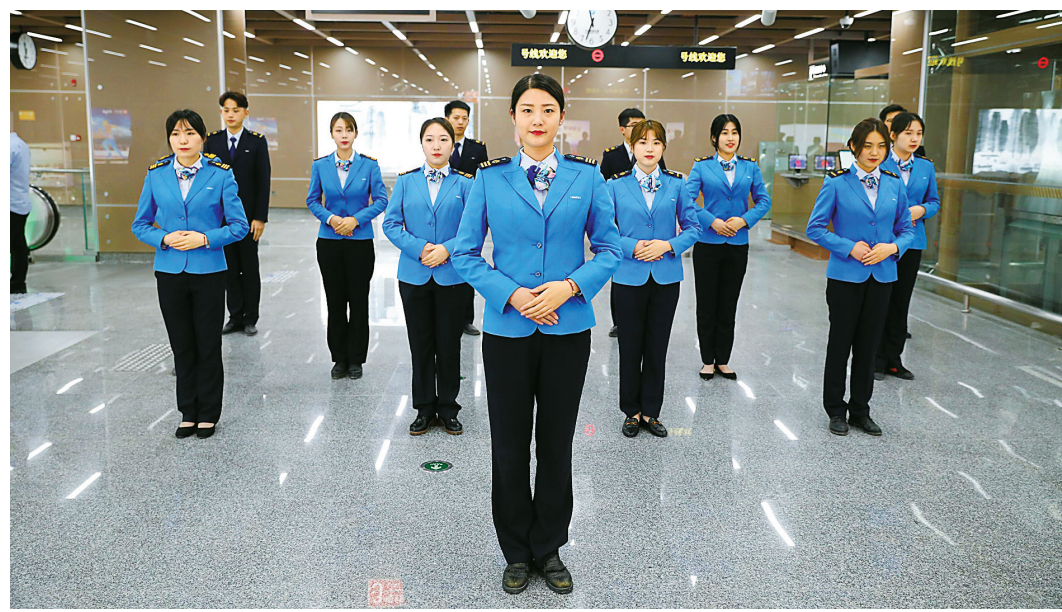
从3号线一期试运营之前3个月开始, 工作人员就积极开展运营培训。