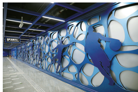
体育馆站文化墙《雨城律动》。