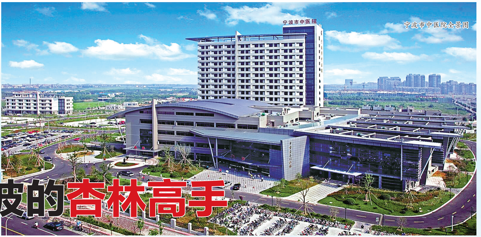
宁波市中医院全景图

这些中医大家用自己高超的医技，为宁波人的健康保驾护航。更为重要的是，他们甘作人梯，诚心育才，桃李满枝，为中医事业培养了一大批接班人。