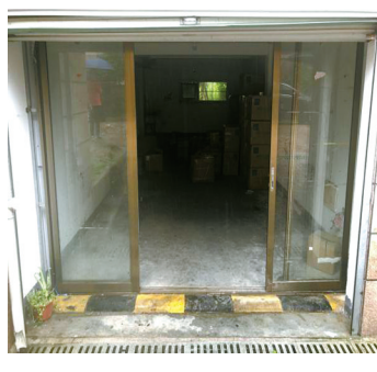
116号别墅车库内的“美容院”已经搬离。