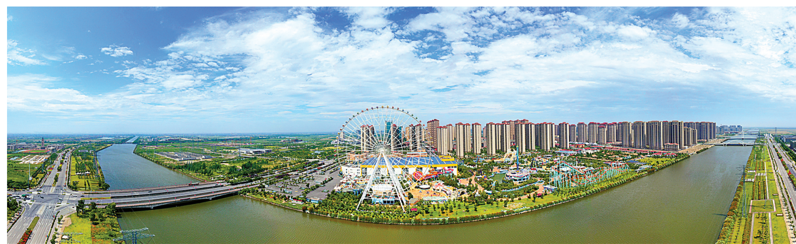
宁波杭州湾新区正在创建沪甬合作示范区。

市委市政府主要领导在多个场合强调，作为长三角一体化发展先行区，宁波已经试点开展长三角地区门诊直接结算，上海保交所也将在宁波设立健康保险交易中心。除此之外，宁波将与上海共同编织上海大都市圈空间协同规划，联动推进全省都市区建设，深化教育文化、医疗卫生、养老社保、生态环保的跨区域合作，努力实现同城、同质、同享。