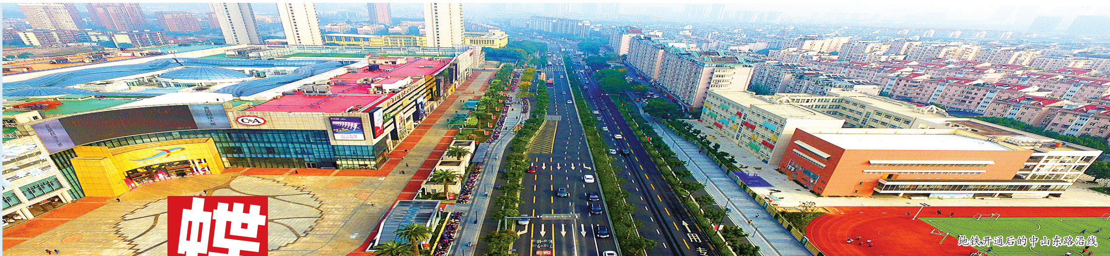
地铁新站房的中山东晓路段