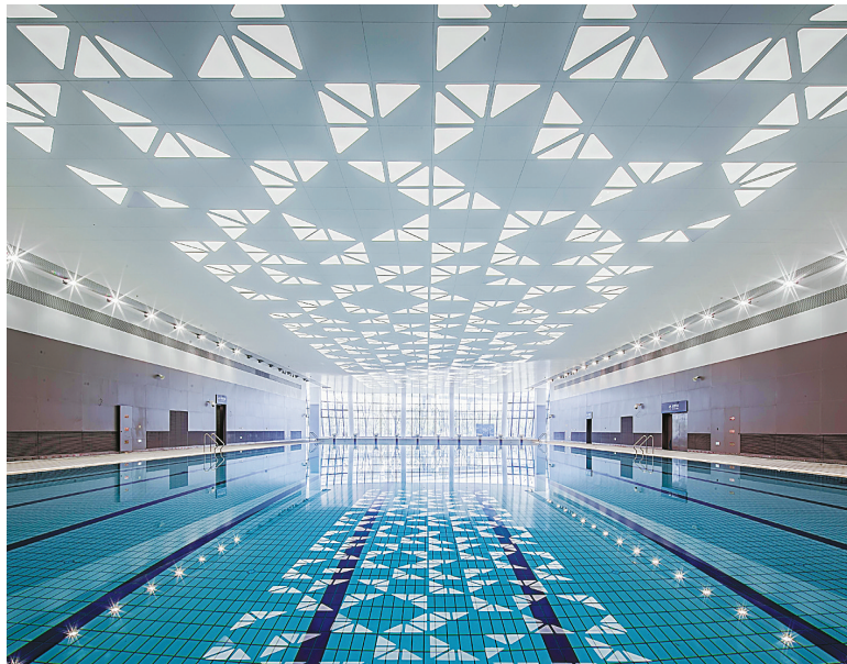
图为奥体中心游泳馆内部场景。

记者了解到,市民可单次购买游泳券,或办理次卡、年卡入场,单次不限时长。其中,次卡可供本人或者其他共同使用。