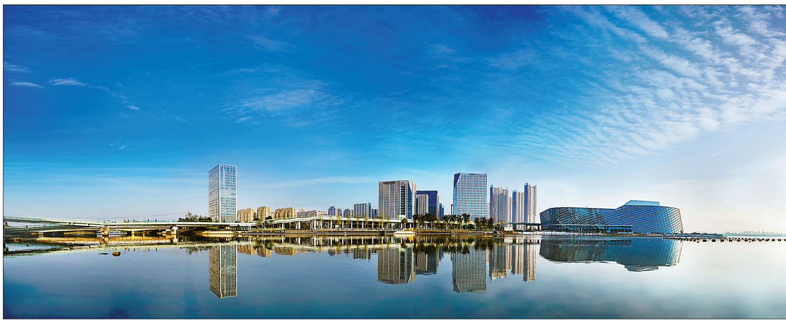
环杭州湾创新中心全景。(资料图)

习近平总书记历来高度重视、积极倡导长三角一体化发展。早在2003年，时任浙江省委书记的习近平同志提出“八八战略”，其中一条就是要“进一步发挥浙江的区位优势，主动接轨上海、积极参与长江三角洲地区交流与合作，不断提高对内对外开放水平”；2003年5月27日，习近平同志到慈溪调研工作，将杭州湾跨海大桥奠基日比喻为“开弓”“一桥飞架南北，天堑变通途”。这为慈溪主动接轨上海、积极融入长三角一体化发展、实现新一轮“开弓”腾飞指明了方向。