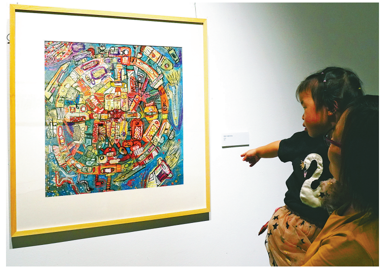
昨天,“庆祝新中国成立70周年——甬港学生书画联展”在宁波美术馆开幕,展出宁波和香港两地小学生创作的55幅书画作品,表达孩子们对美好生活的向往。此次展览由宁波市文学艺术界联合会、宁波甬港联谊会共同主办,将持续至8月4日。