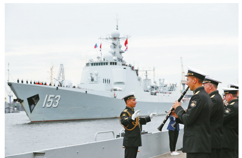
7月24日,在俄罗斯圣彼得堡涅瓦河畔,俄罗斯军乐队在西安舰欢迎活动上演奏。中国海军第三十二批护航编队西安舰24日抵达俄罗斯圣彼得堡进行访问,并准备参加俄罗斯海军节庆祝活动。