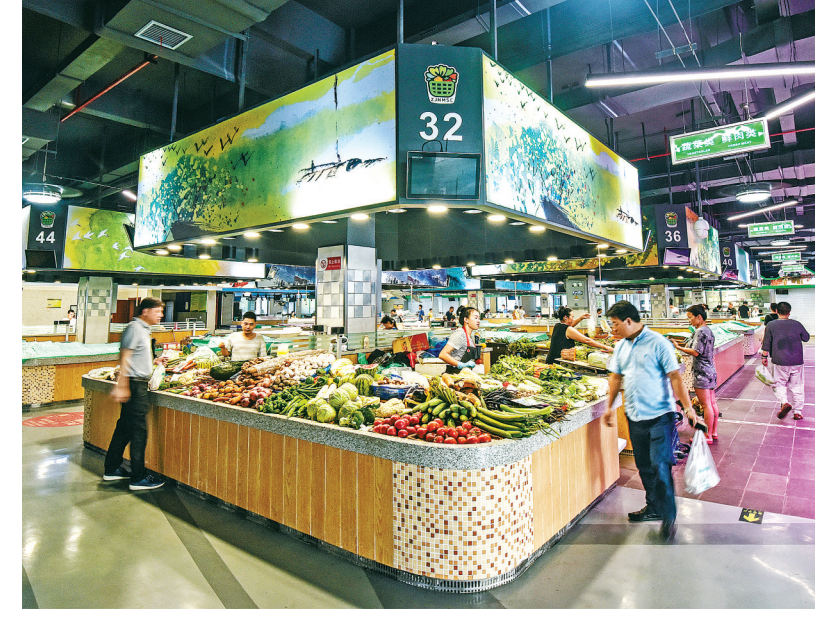
设施一新的五星级智慧菜市场。

兜底工程，推进一批养老、医养结合体项目建设。截至2018年，全市拥有养老机构266个，床位数量5.9万张，超过全国平均水平。 文化传承历久弥新—— 宁波历史悠久，河姆渡遗址博物馆向人们诉说着这片土地7000年的文明发展史，天一阁的改造扩建向全世界传播着“书藏古今”的美丽传说，保国寺历经千余年风雨侵蚀依然矗立。在文物设施保护开发的同时，坚持文化为民，建成大剧院、图书馆、博物馆、宁波书城等一批重大文化设施和奥体中心、游泳中心等一批重大体育场馆设施，建成影院99家，银泰城达到717块，大力推进溪口雪窦山名山建设，文化广场等重点工程建设，使传统与现代文化在宁波交相辉映。大力发展文化产业，一批文化战略合作项目、文旅融合项目、文化制造项目、文化休闲项目持续推进，方特东方神画景区2018年接待游客252万人次，实现旅游收入约5亿元，宁波的文化影响力不断提升。 近年来，宁波市委、市政府坚持把重点工程建设作为推动宁波经济社会高质量发展的重要抓手，深入实施“三年行动计划”“六军攻坚、三年攀高”等一系列重大决策部署，宁波的基础设施、城市面貌、人民生活发生了翻天覆地的变化。