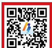
中国宁波网手机版

天气: 今天多云; 偏南风2-3级; 26℃-34℃ 明天多云; 南到东南风2-3级 今日市区空气质量预测: 轻度污染