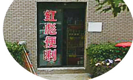
▲8月14日，锦绣东城小区14幢1层破墙后，门越开越大。