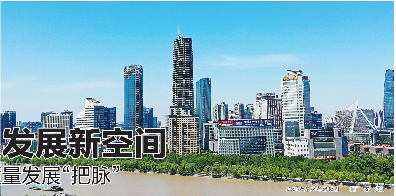
三江六岸局部俯瞰图