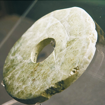
拼版照片:这是良渚遗址出土的黑陶器、玉琮、木屐、漆器、陶片和玉璧。