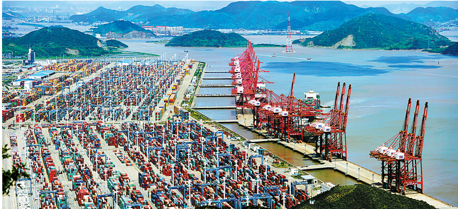
远眺码头，这里跳动着宁波舟山两地的“工业心脏”。