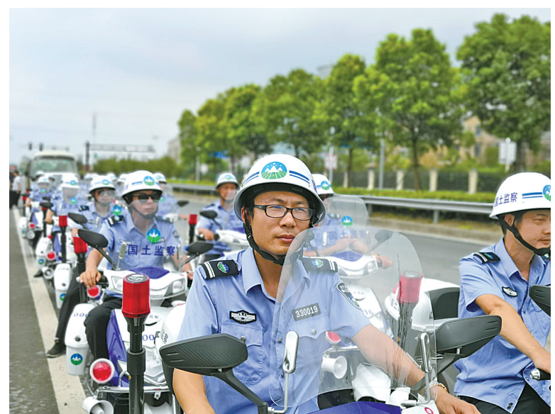
“三改一拆”控新“铁军”整装待发。