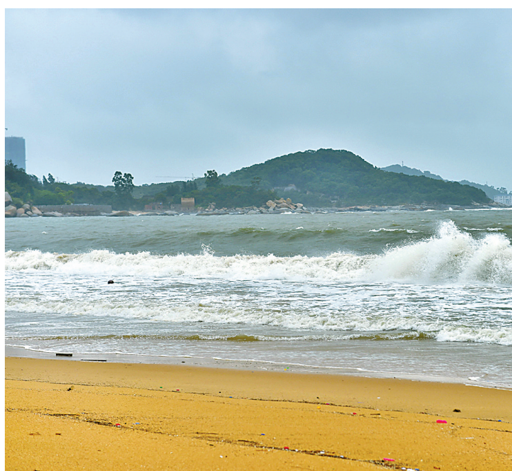
8月25日拍摄的东山马塞湾景区海水浴场。 8月25日,今年第11号台风“白鹿”于7时25分在福建省东山沿海登陆,登陆时中心附近最大风力10级(25米/秒,强热带风暴),中心最低气压988百帕。