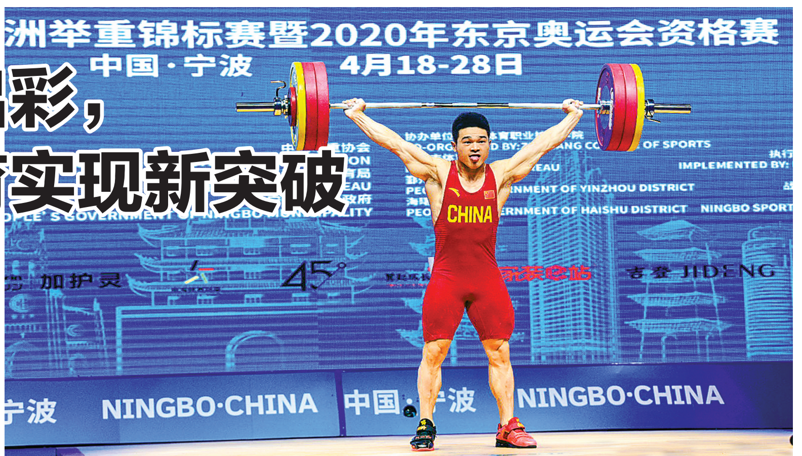
石智勇打破世界纪录。