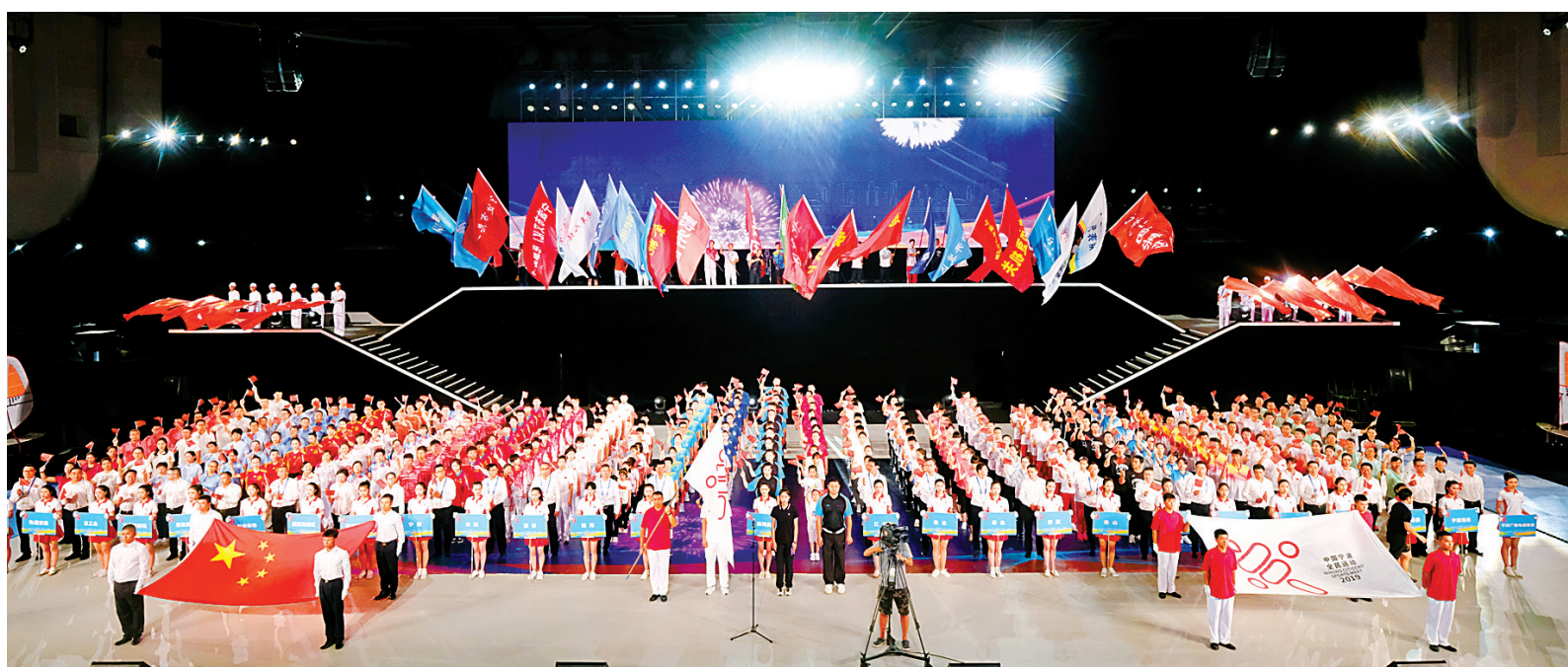
宁波市首届全民运动会暨第十八届市运会开幕式现场。

本报讯(记者徐展新 林海)全民参与,全民运动,全民健康。昨晚,一台以“运动惠民快乐甬城”为主题的晚会在雅戈尔体育馆上演,宁波市首届全民运动会暨第十八届市运会正式开幕。省委副书记、市委书记郑栅洁宣布运动会开幕,市委副书记、市长裘东耀致开幕词。