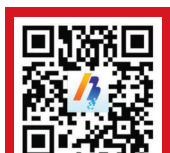
中国宁波网手机版