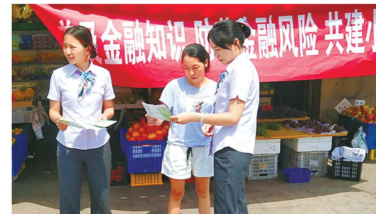
农行宁波市分行工作人员走进社区宣传金融知识。

同时,该行员工积极“走出去”,深入社区、农村、学校、广场等场所,向老年人、农村人口、学生、外来务工人员等人群开展宣传。目前已经开展20多次集中宣传活动,累计发放1万多份宣传折页。如农行余姚支行走进九垒山村、同光村、六湖村开展设摊宣传,向村民发放各类金融知识折页,并提供面对面业务咨询和问题解答,受到村民的热烈欢迎。农行奉化支行利用开学时间点,进入各高校对“套路贷”、电信网络诈骗等违法违规金融活动进行普及教育,提高大学新生的金融风险防范意识。(高章国)