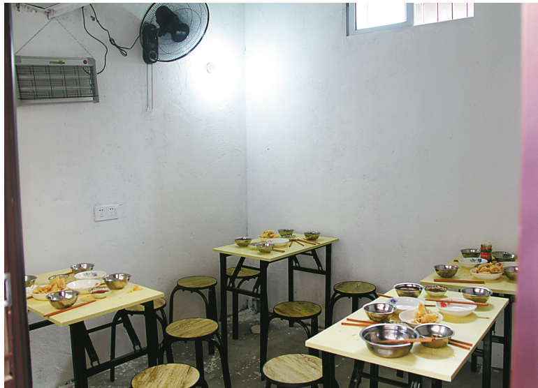
开在车棚里的校外“小餐桌”。

“这些无证‘小餐桌’不仅没有营业执照、食品经营许可证等相关证照,而且食品加工、就餐区域狭小,室内闷热无比,卫生条件跟不上,缺乏必要的消毒设施,从业者也无健康证,身体状况未知,提供的饭菜营养搭配不均衡。时间一长,会影响孩子们的身体健康。”市场监管部门相关负责人告诉记者